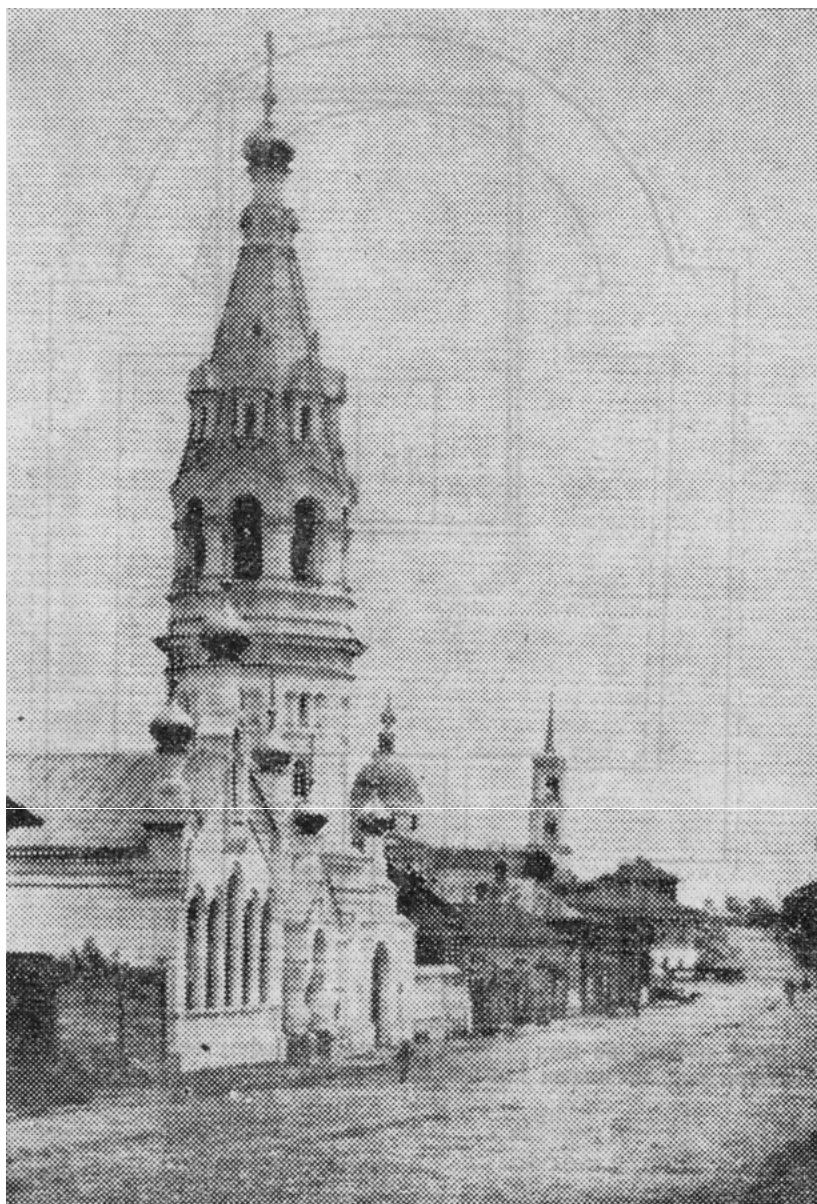
Старообрядческий храм во имя Всех Святых в г.Боровске.