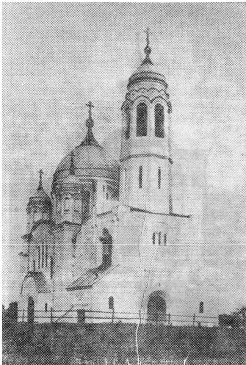
Старообрядческий храм во имя Покрова Пресвятой Богородицы 2-ой общины в г.Боровске.