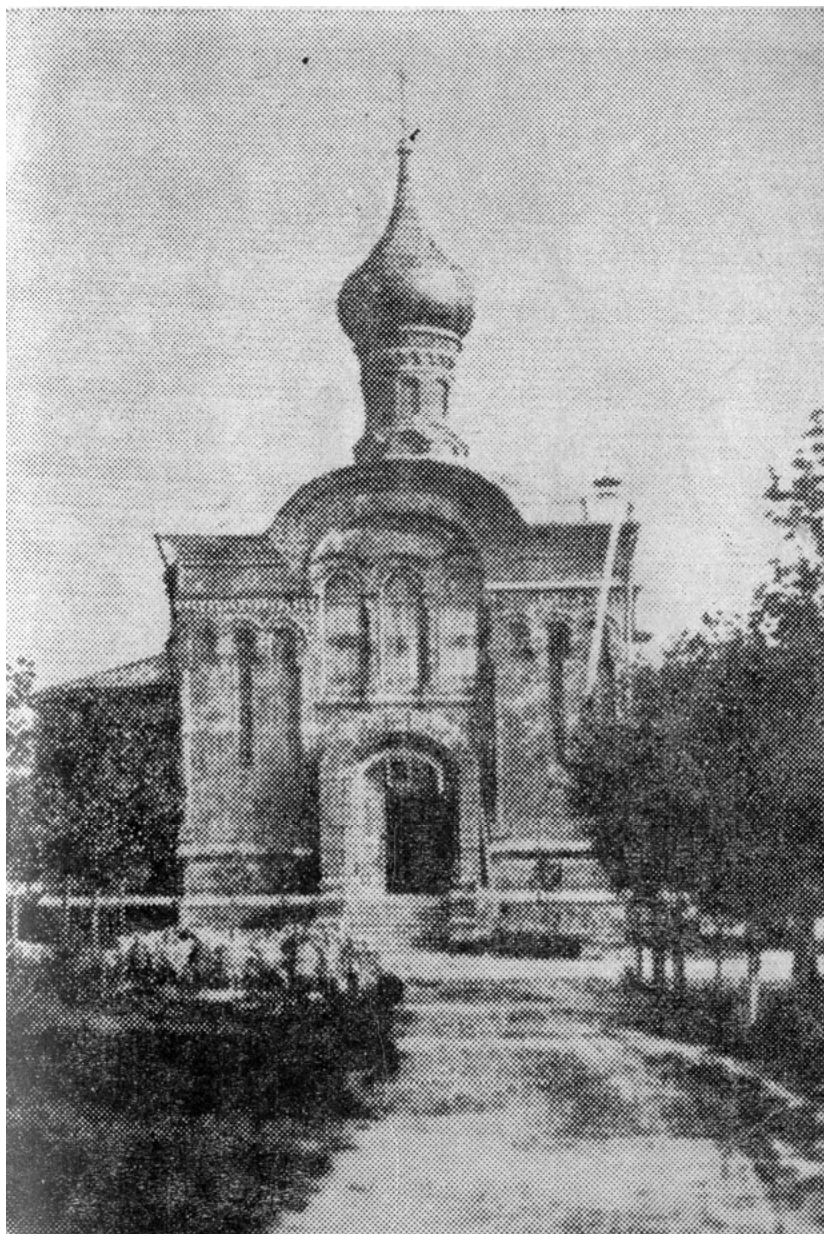
Старообрядческий храм во имя Покрова Пресвятой Богородицы 1-ой общины в г.Боровске.